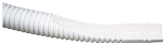
Sezione del tubo